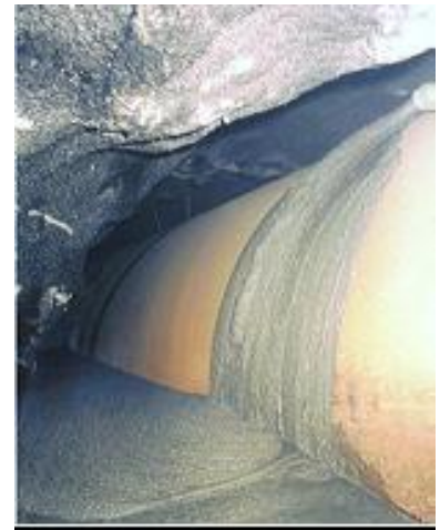
Mise en œuvre d'un coulis