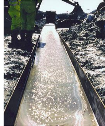
Mise en œuvre d'un coulis

L'Injex® fait l'objet d'un manuel d'assurance qualité.